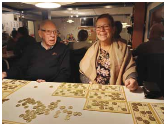
Kom så med den!