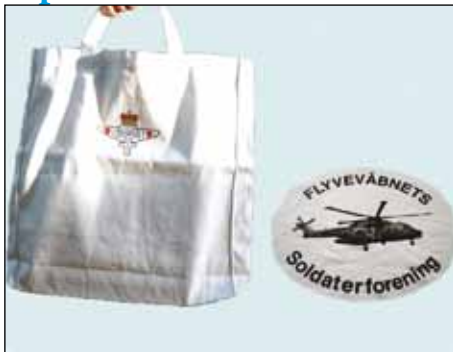
Mulepose, tryk på begge sider