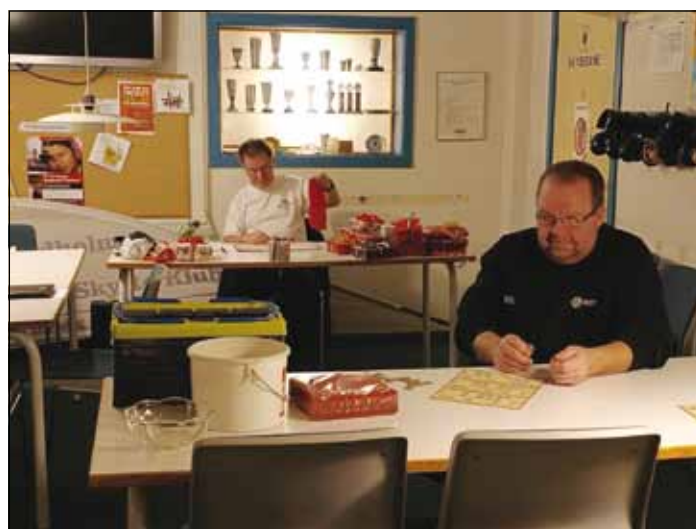
Posen rystes grundigt