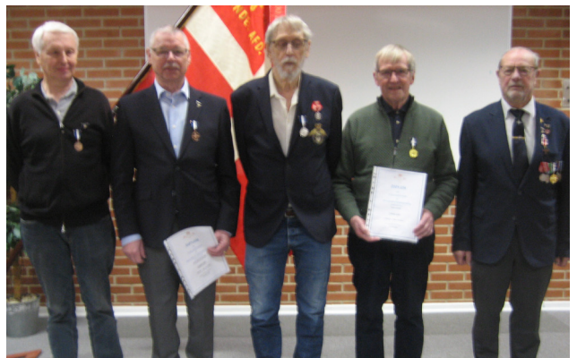
Medaljemodtagere ved FSF Lokalafdeling Vandels generalforsamling 2025.

Henvendelse kan ske til FSF Lokalafdeling Vandels formand (E-mail jensogbirgit@profibermail.dk ) eller direkte til FSF's forretningsfører (E-mail fsf@propel.dk ).